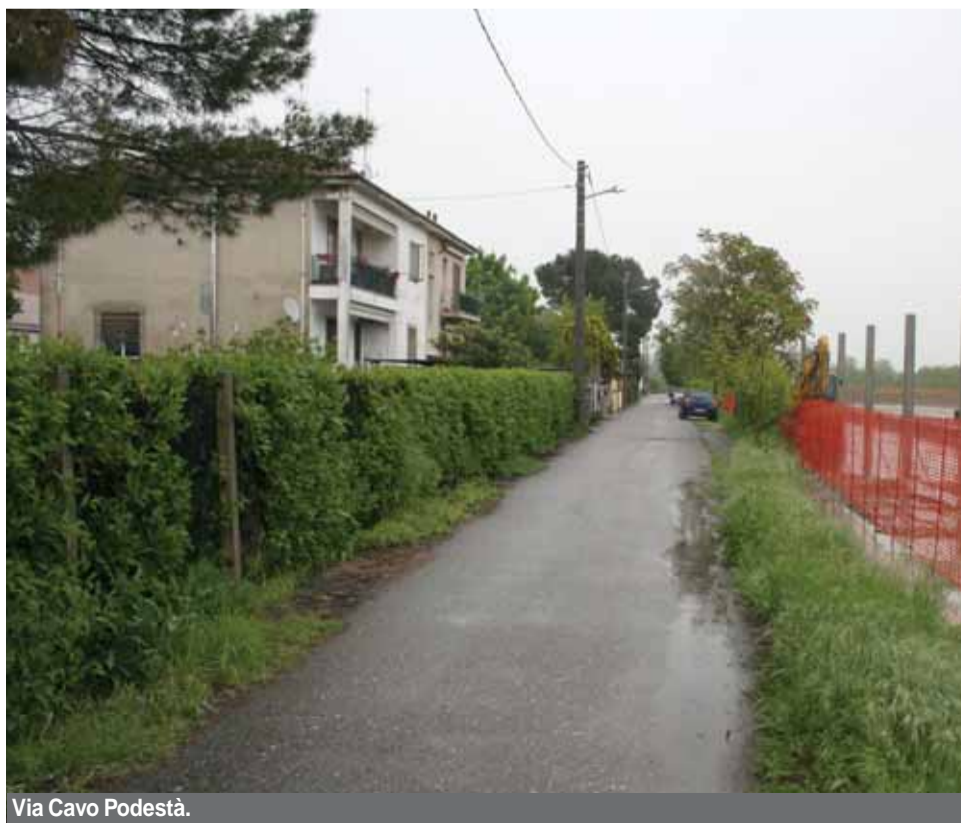
Via Cavo Podestà.

Interventi, come già ribadito in un'altra pagina del giornale, eseguiti a "macchia di leopardo". Vie parallele e molto vicine fra loro che hanno avuto, però, destini diversi. A quanto ci è dato sapere gli uffici preposti non hanno eseguito nessuno studio preliminare per individuare a quali strade dare la priorità rispetto ad altre molto simili. Ecco altri esempi di scelte che non seguono criteri precisi, ma sembrano dettati dal caso. Via Alba, Aosta, Ivrea e Cavo Podestà. Quattro piccole vie che collegano corso Novara con la parallela via Campeggi. Anche in questo caso le soluzioni adottate dall'Amministrazione non si comprendono pienamente. Le prime tre, infatti, sono deputate per passare alla proprietà pubblica, la quarta, via Cavo podestà, invece, resterà privata. Perché? Inoltre la stessa via Campeggi resterà privata. Quali sono, anche in questo caso, i criteri che hanno spinto gli amministratori a questa decisione? Ce lo devono spiegare. Da sottolineare, però, che diverse scelte sono state fatte scon criteri ben precisi e dettate da una precisa logica. Comunque, fra le circa 300 strade private presenti sul territorio comunale, si possono trovare molti altri esempi simili a quelli illustrati.