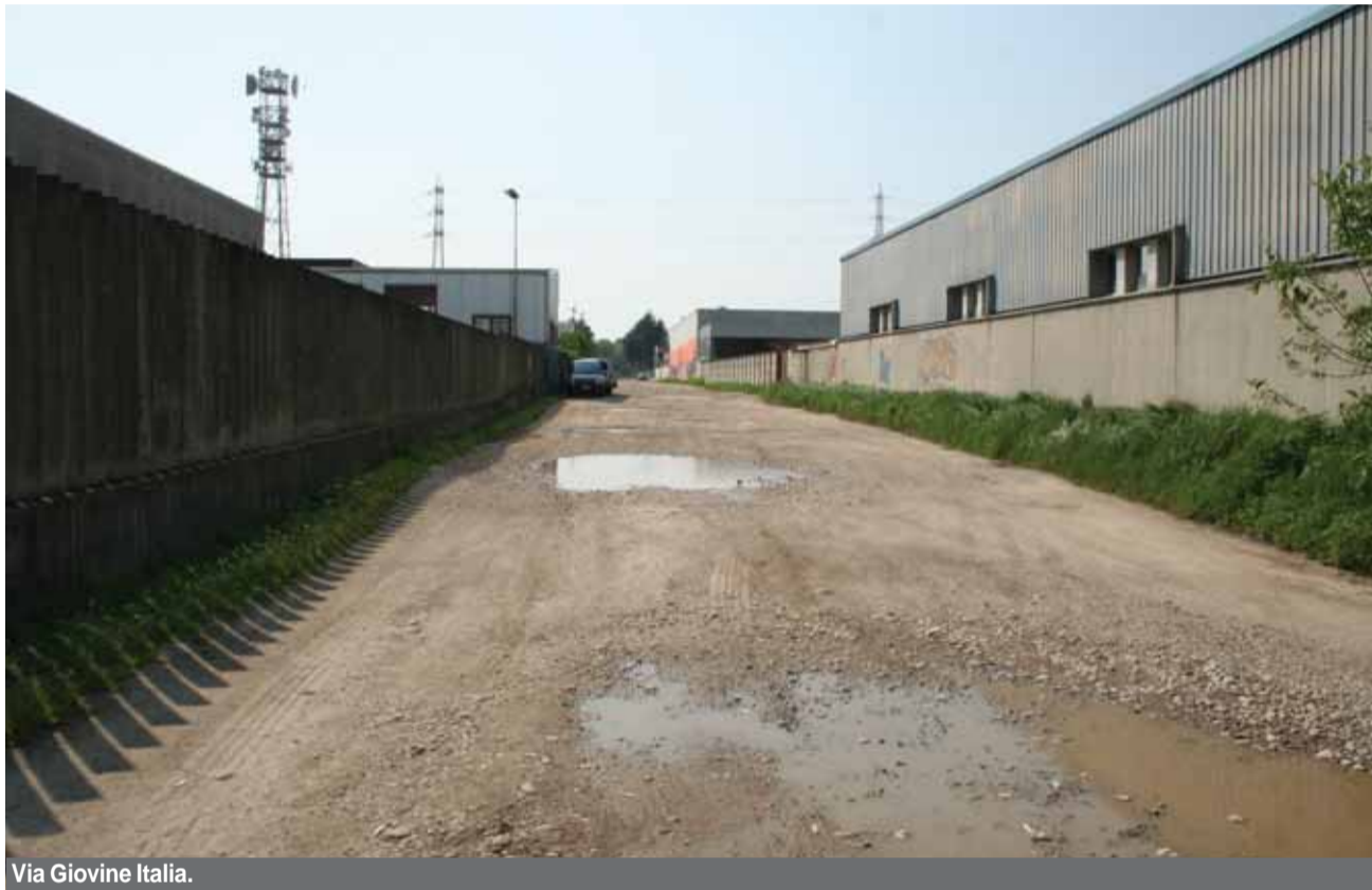
Via Giovine Italia.

A Vigevano, come in quasi tutte le città italiane, sono presenti un gran numero di strade private. In questi anni l'Amministrazione sta portando avanti le pratiche per acquisirle al patrimonio comunale ma non si comprende il criterio di scelta adottato.