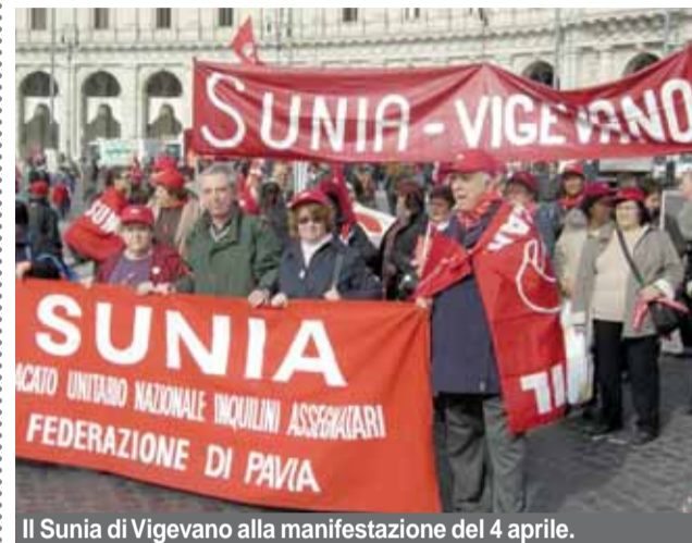
Il Sunia di Vigevano alla manifestazione del 4 aprile.

I problemi della casa devono essere affrontati con urgenza