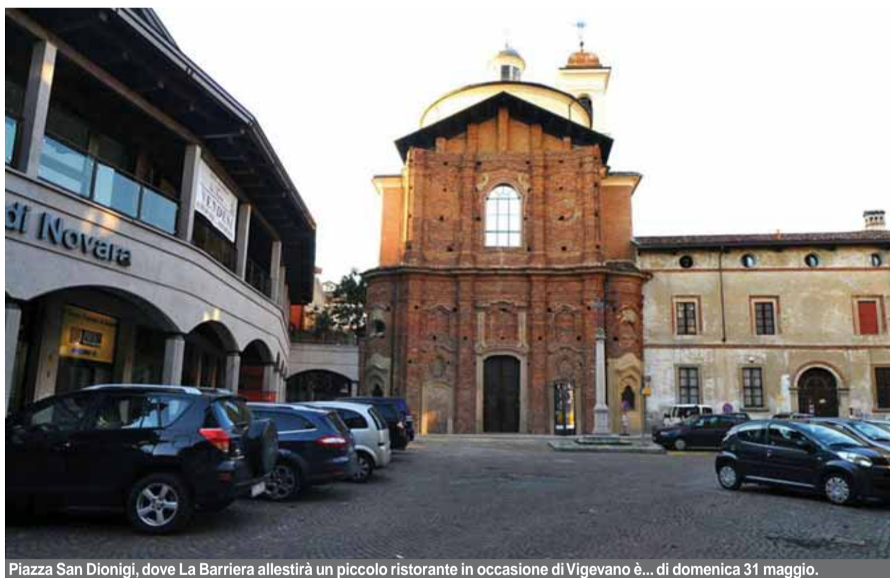
Piazza San Dionigi, dove La Barriera allestirà un piccolo ristorante in occasione di Vigevano è... di domenica 31 maggio.