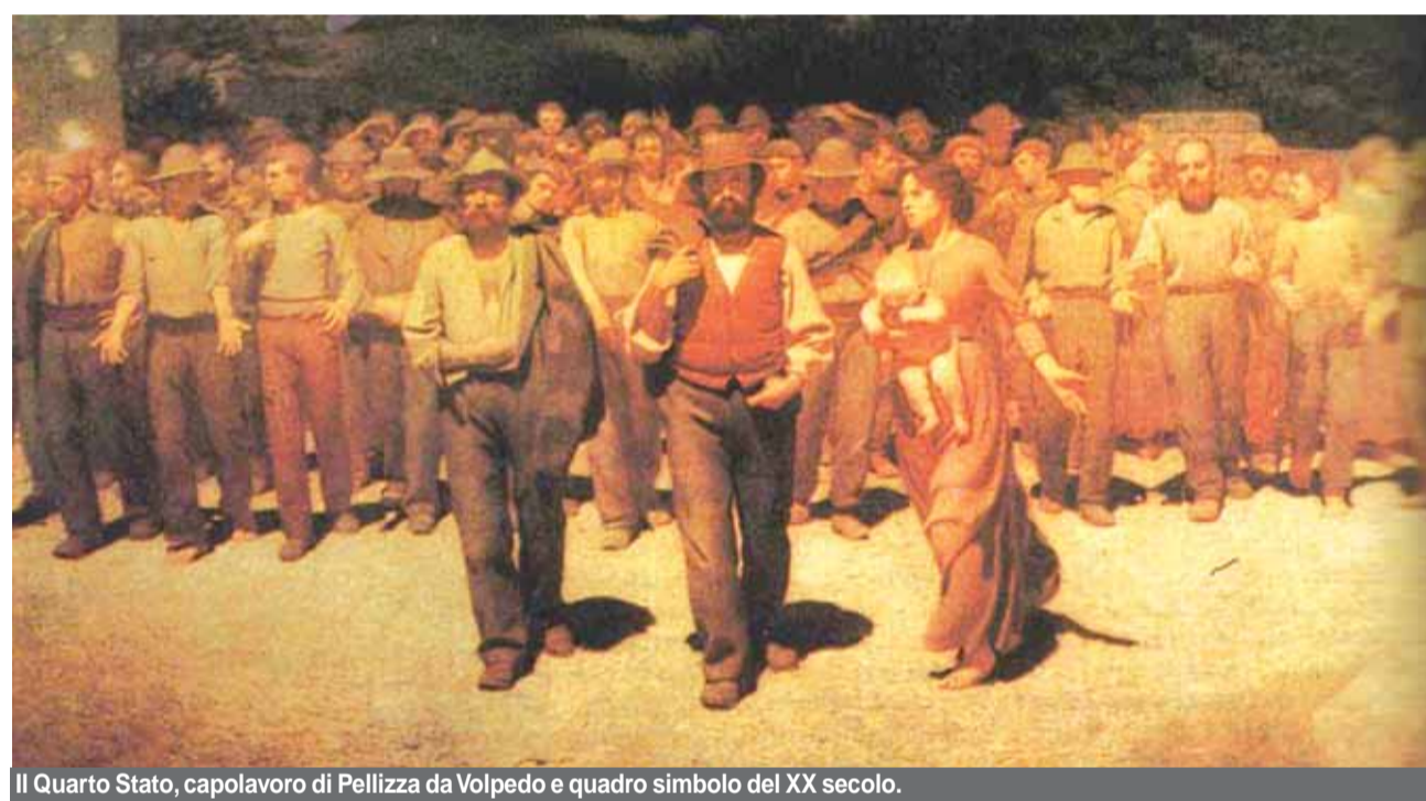
Il Quarto Stato, capolavoro di Pellizza da Volpedo e quadro simbolo del XX secolo.

Per lui la capacità di rappresentare gli interessi generali del lavoro diventa il carattere costitutivo del sindacato moderno ed ogni suo sforzo è teso a costruire un sindacato confederale generale ad adesione volontaria, autonomo dai padroni, dai governi e dai partiti che, partendo dalle condizioni di lavoro, sap-