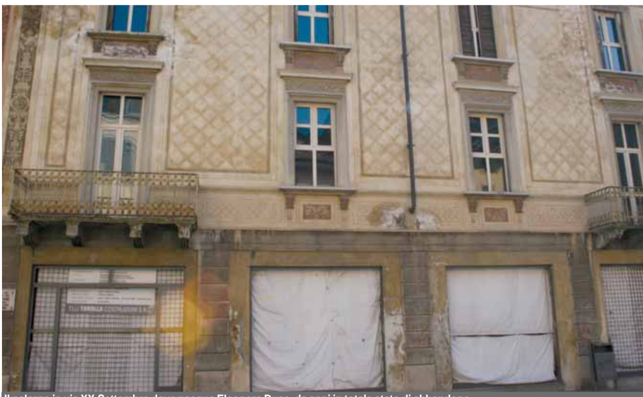
Il palazzo in via XX Settembre dove nacque Eleonora Duse, da anni in totale stato di abbandono.

Approvato, in Consiglio comunale, un provvedimento che obbliga i proprietari a rimettere a nuovo le facciate degli edifici in centro. Modificato l'articolo che imponeva di ripulire i muri imbrattati dai vandali.