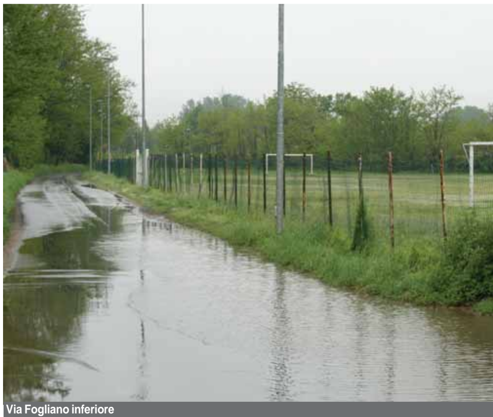
Via Fogliano inferiore