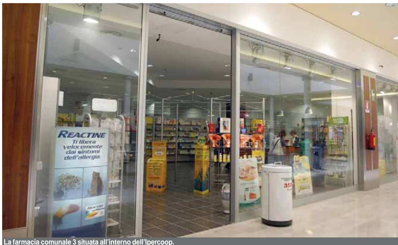
La farmacia comunale 3 situata all'interno dell'Ipercoop.

La Giunta giustificò allora la scelta in base a due fattori: la necessità di scaricare su una nuova società parte del bilancio comunale, per poter