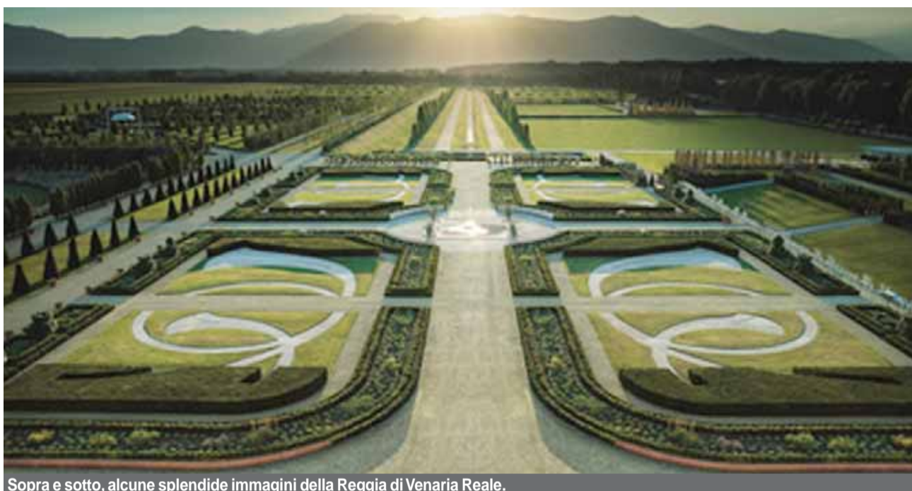
Sopra e sotto, alcune splendide immagini della Reggia di Venaria Reale.

Venaria Reale ed i suoi giardini è uno degli esempi del nostro patrimonio artistico recuperato e riportato allo splendore di un tempo, con un eccezionale e sapiente lavoro, compiuto con la collaborazione di più forze, che hanno permesso di restituirlo all'uomo di oggi, all'arte, alla cultura del nostro tempo candidandolo a preziosa sede di mostre ed eventi internazionali.