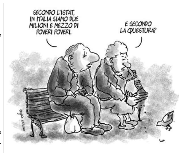
per gentile concessione de l'Unità e di Sergio Staino