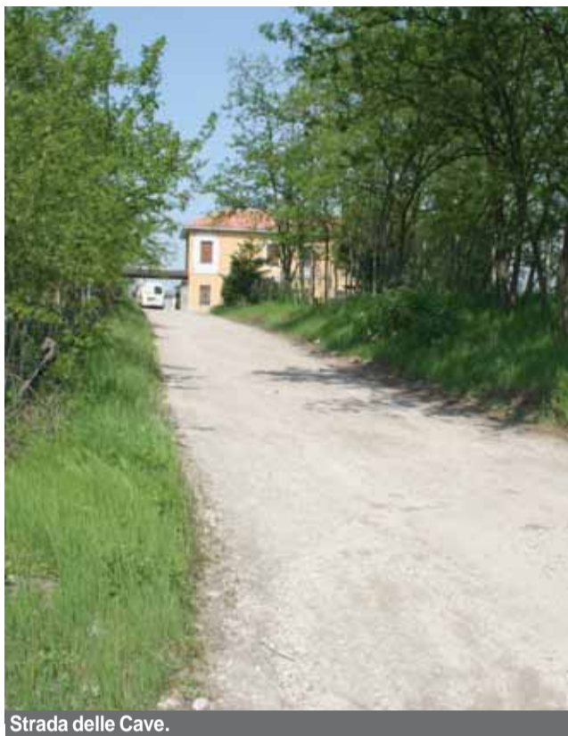
Strada delle Cave.

Il passaggio di una strada privata al patrimonio comunale dovrebbe seguire criteri oggettivi e non essere lasciato al libero arbitrio dell'assessore di turno. In queste pagine presentiamo alcuni esempi che non ci sembrano molto ortodossi. La foto qui a fianco ci mostra Strada delle cave (in procinto di diventare pubblica), che collega il Parco Longo a viale Artigianato. Come si può notare è una via di poco o nulla utilità pubblica in quanto dalla Brughiera è molto più comodo e, soprattutto, sicuro utilizzare la rotonda di via San Giovanni. A destra un altro esempio di strada privata, che diventerà comunale: via Montevecchio. Questa strada collega il nulla con il nulla. Ci devono spiegare, quindi, l'utilità che ne deriva alla cittadinanza. Sotto altri due esempi simili ma con esiti diversi. Via Lucania e via Palestro, sono strade a fondo chiuso. La prima diventerà pubblica, la seconda no. In base a quali scelte? Non si sa... In basso, infine, possiamo ammirare due splendidi esemplari di strade di campagna: Fogliano inferiore e via Primavera (questa, peraltro, già dotata di illuminazione pubblica). Anche queste diventeranno pubbliche.