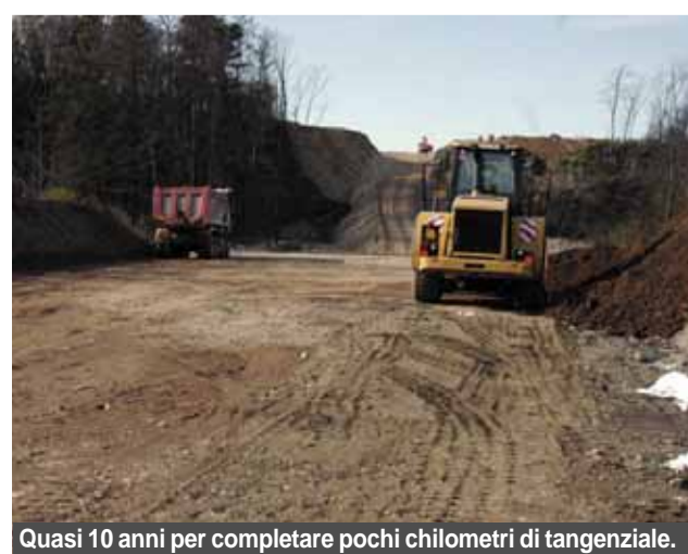
Quasi 10 anni per completare pochi chilometri di tangenziale.