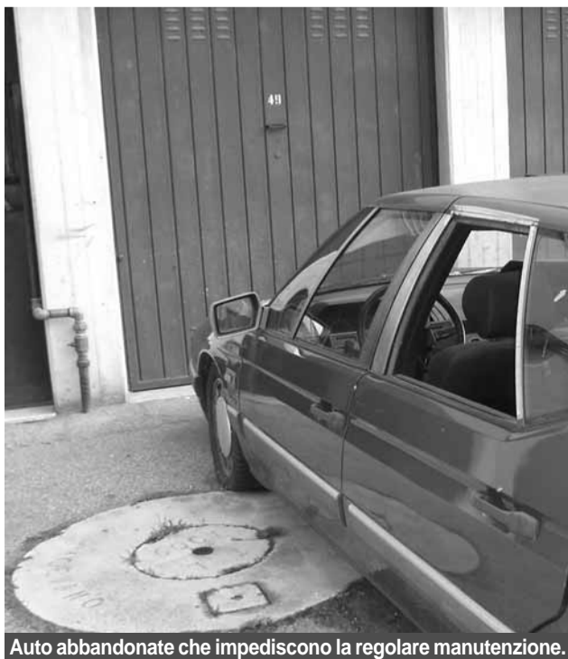
Auto abbandonate che impediscono la regolare manutenzione.