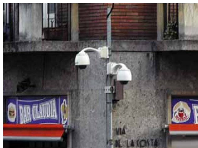
Telecamere in ogni angolo. Migliaia di euro spesi inutilmente.