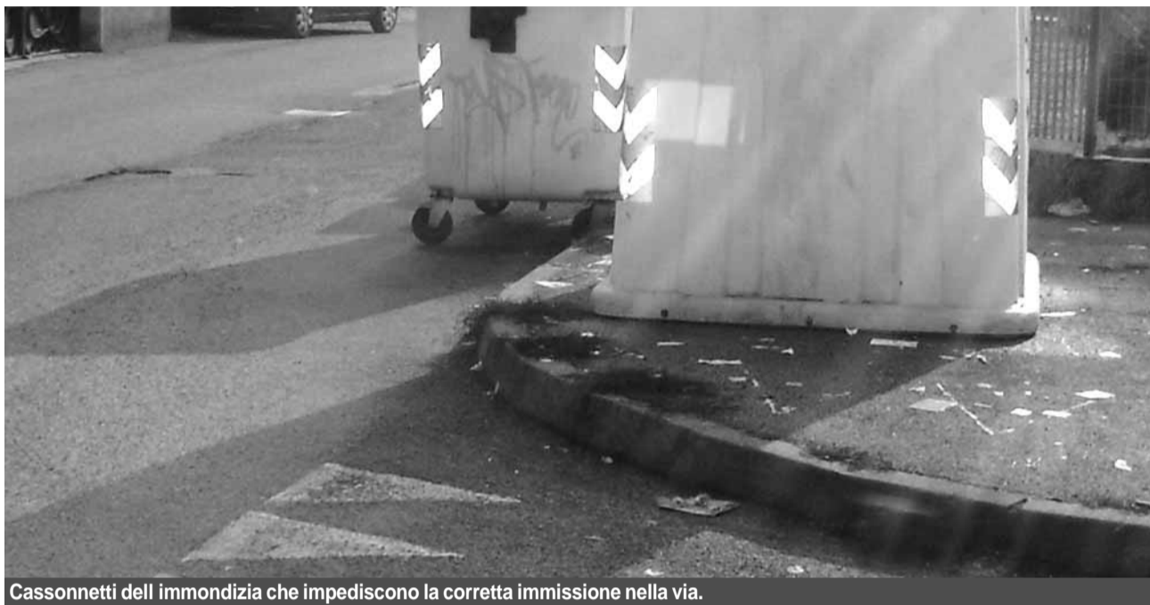
Cassonetti dell'immondizia che impediscono la corretta immissione nella via.

Parlando con gli abitanti delle case Aler abbiamo riscontrato una sorta di stanchezza e di impotenza causate proprio dalle continue promesse non mantenute. Cosa è stato fatto per mi-