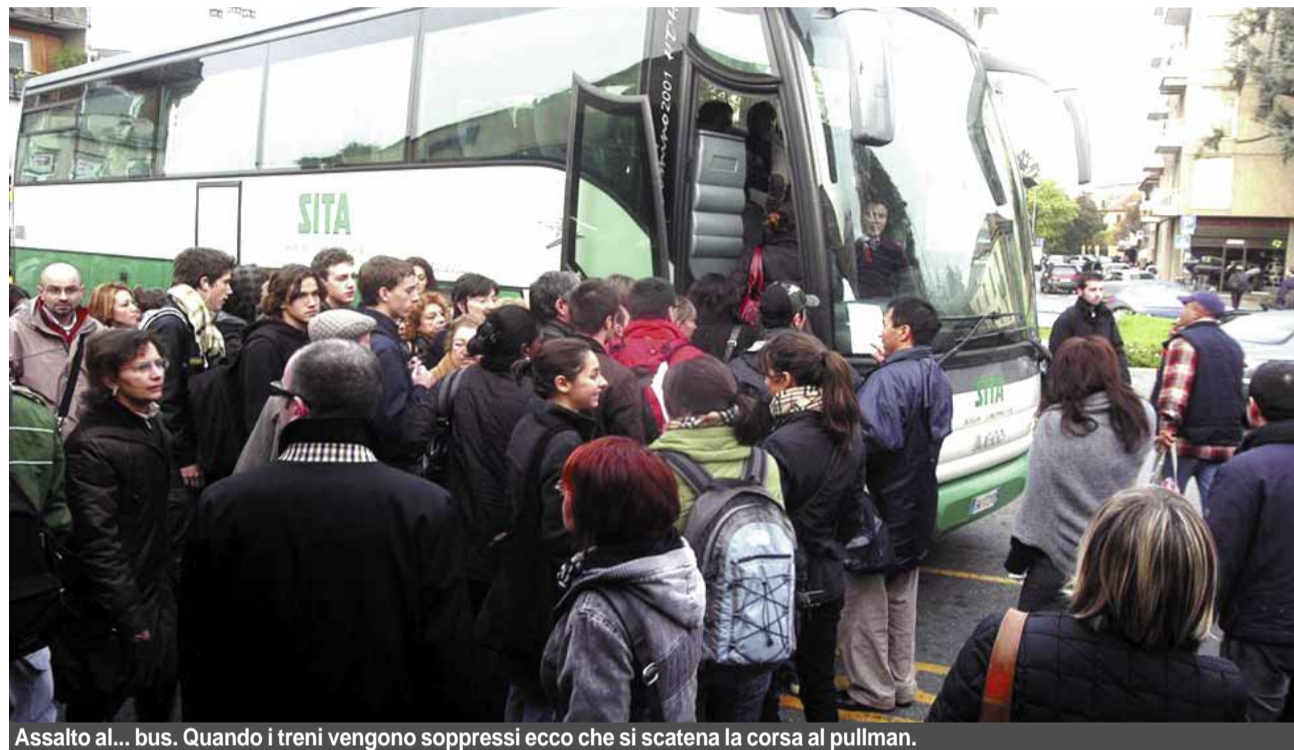
Assalto al... bus. Quando i treni vengono soppressi ecco che si scatena la corsa al pullman.

tidiano si conferma il ruolo predominante dell'auto privata, usata dal 70,2% dei pendolari. Il treno viene utilizzato dal 14,8% di chi è costretto a viaggiare; quasi due milioni di persone che per spostarsi in ambito locale e metropolitano lo utilizzano come unico mezzo di trasporto o in combinazione con altri mezzi (metrò e bus). La percentuale sale notevolmente tra gli studenti (32,7%). La spesa mensile a carico dei pendolari che utilizzano il treno è in media di 49,20 euro.