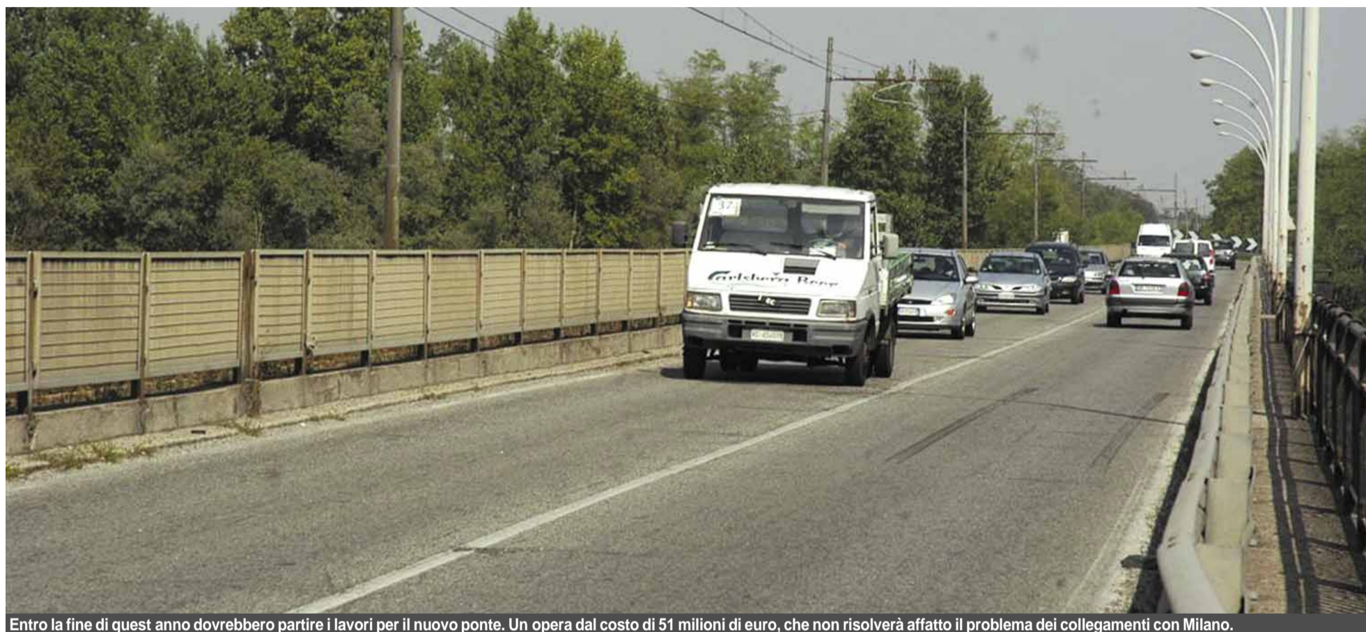
Entro la fine di quest'anno dovrebbero partire i lavori per il nuovo ponte. Un'opera dal costo di 51 milioni di euro, che non risolverà affatto il problema dei collegamenti con Milano.

La giunta di centro destra governa questa città dalla primavera del 2000. Sin da allora i nostri amministratori non hanno perso l'opportunità di comunicarci i loro progetti per il rilancio di Vigevano. Abbiamo voluto verificare, tramite i giornali custoditi all'Archivio storico, se quelle promesse sono state mantenute. La sorpresa è stata grande.