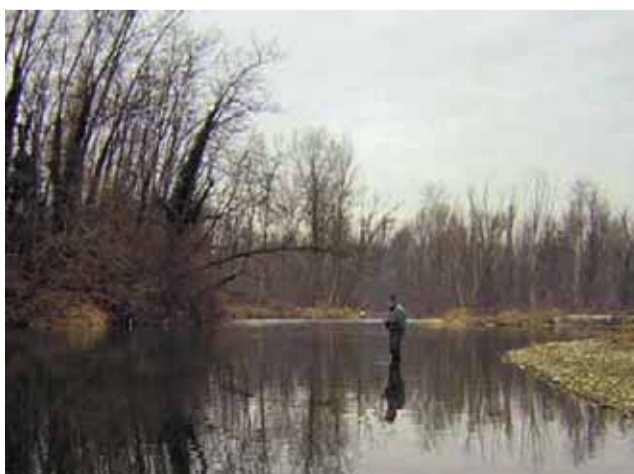
Turismo in Lomellina per rilanciare l'economia...