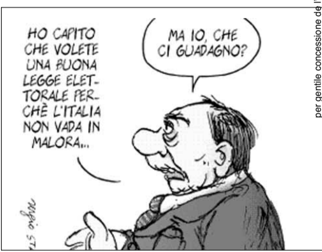
per gentile concessione di l'Unità e di Sergio Staino

sindaco, al proprio ministro protettore, che non lesina vittorie nei pubblici concorsi, posti e collocazioni di prestigio, carriere e successi politici in enti pubblici e affini, che è un vero fiore all'occhiello dell'Italia d'oggi. I suoi abitanti più che cit-