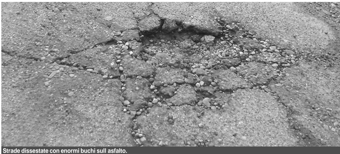
Strade dissestate con enormi buchi sull'asfalto.

gliorare la sicurezza in quella via? Nulla se si conta che non c'è il marciapiede e le persone devono camminare rasenti ai muri per evitare le au-