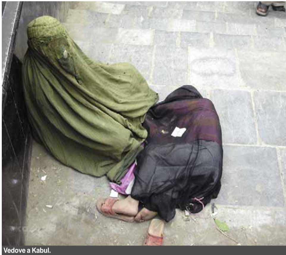
Vedove a Kabul.

L'occasione per iniziare a conoscere un po' meglio questo mondo non può prescindere dalla testimonianza delle sue figlie meno amate, di coloro che raccontano istanze sociali e religiose che quelle