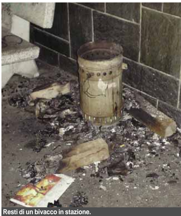
Resti di un bivacco in stazione.

L'ultima "novità" (lunedì 28 gennaio) vissuta in prima persona da chi scrive è il tentato scippo del portafogli dalla borsa di una pendolare sul treno delle 7.47 da parte di un gruppetto di bambini rom. Parlo di bambini perché l'età media dei componenti il gruppetto sarà stata di nove, dieci anni, non di più. Da alcune testimonianze raccolte sul treno e alla stazione di Porta Geno-