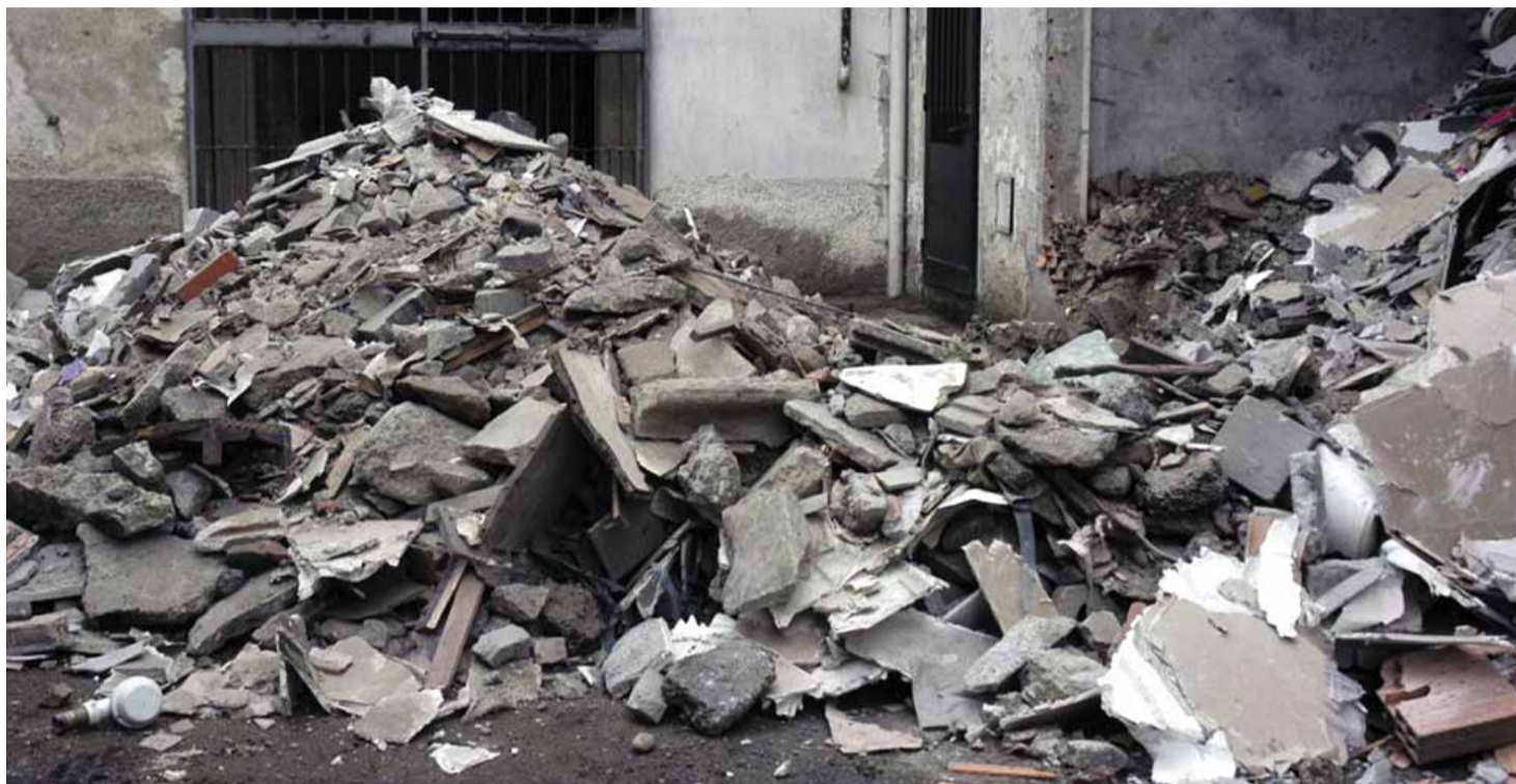
La discarica abusiva negli spazi dell'ex macello.

b) con la pena dell'arresto da sei mesi a due anni e con l'ammenda da due-