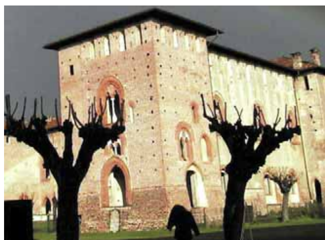
Il Maschio: la ristrutturazione doveva partire nel 2003.