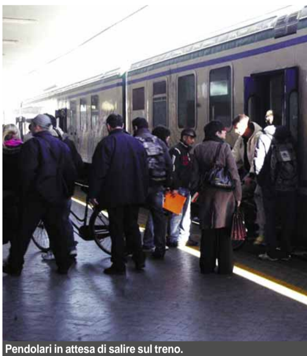
Pendolari in attesa di salire sul treno.

Veniamo ora al capitolo lamentele: il Censis riscontra che i problemi più gravi riferiti al treno si concentrano soprattutto sul fattore "tempo": la partenza in ritardo del convoglio (32%) e l'arrivo a destinazione oltre l'orario previsto (31%).