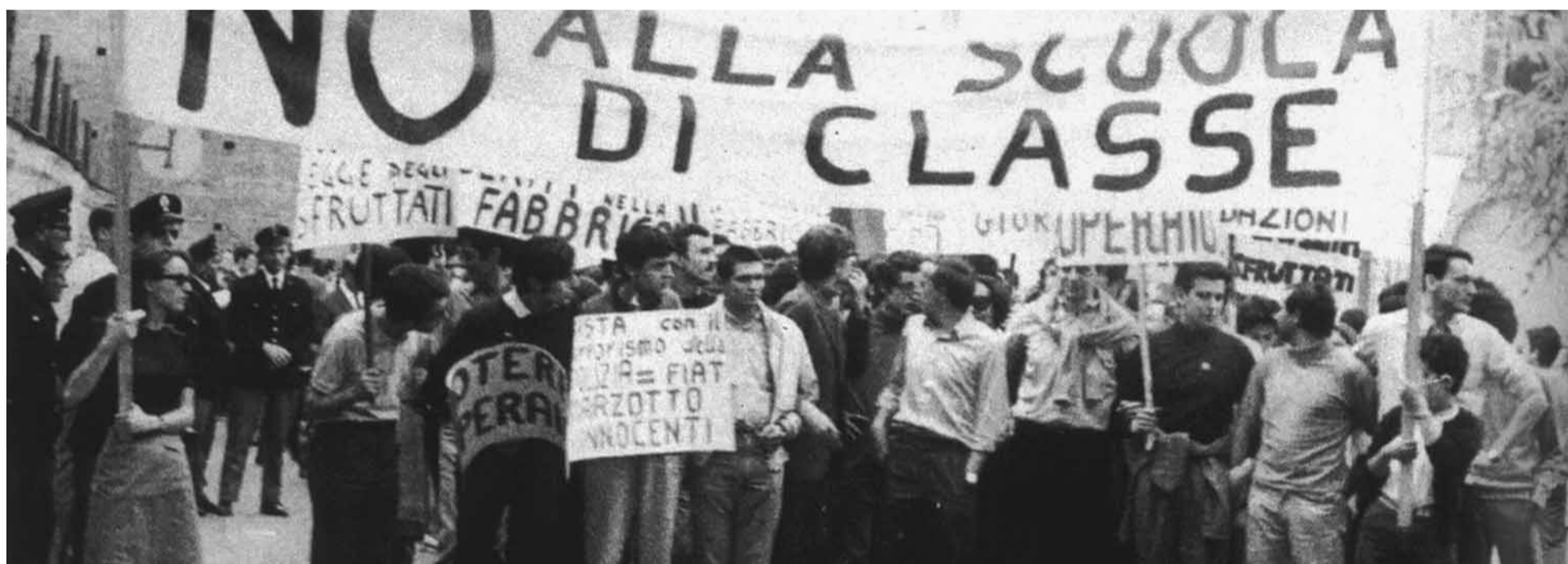
Manifestazione di studenti in piazza L. da Vinci a Pavia (Foto tratta dal libro "Operai e contadini", edizioni Effigie, stampato in occasione del centenario della Camera del Lavoro di Pavia).

mo lottato, abbiamo fatto le nostre rivendicazioni, abbiamo raggiunto i nostri obiettivi. La lotta per i turni nelle interrogazioni non voleva essere il sistema per studiare di meno, ma studiare in maniera programmata e quindi meglio. Le assemblee nella palestra del Casale - frequentavo ragioneria - era il modo per coinvolgere tutti gli studenti in un nuovo modo di studiare. L'elezione dei rappresentanti di classe, prima dell'ingessatura ministeriale, era la volontà di partecipare alla gestione scolastica. I gruppi di studio pomeridiani erano un modo di studiare tutti assieme, per dare a tutti le stesse possibilità. La richiesta di gite culturali non era il sistema per 'bigiare' un giorno, ma per conoscere la realtà che un doma-