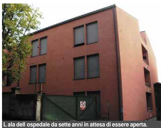
L'ala dell'ospedale da sette anni in attesa di essere aperta.