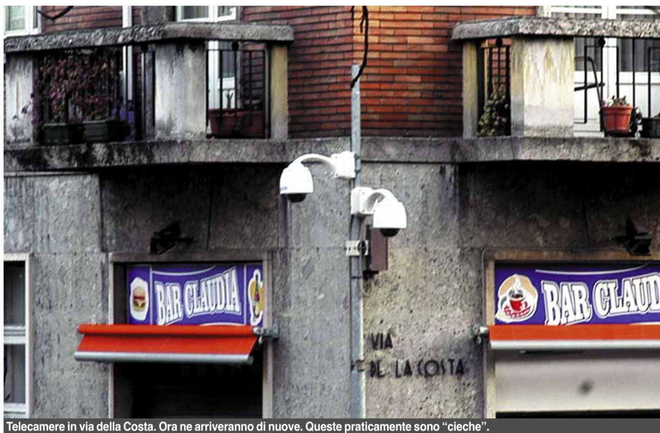
Telecamere in via della Costa. Ora ne arriveranno di nuove. Queste praticamente sono "cieche".