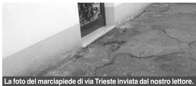
La foto del marciapiede di via Trieste inviata dal nostro lettore.