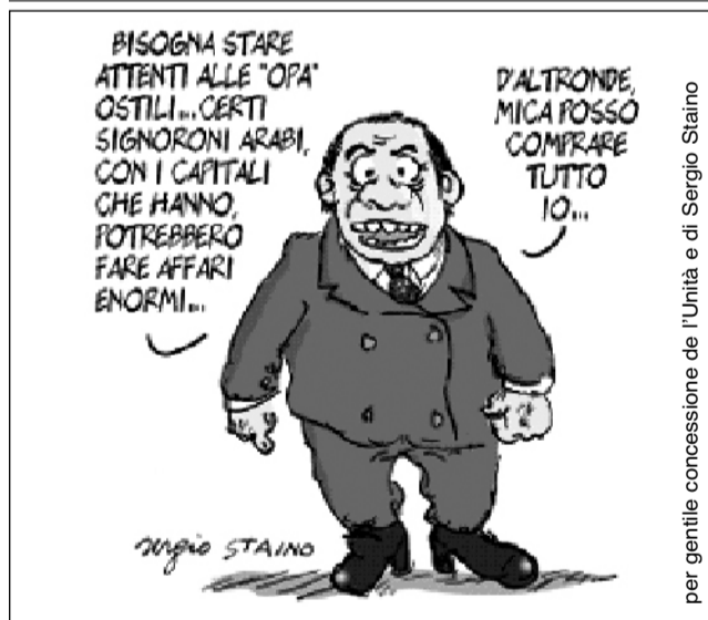
per gentile concessione de l'Unità e di Sergio Staino