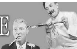
di Antonio Testa