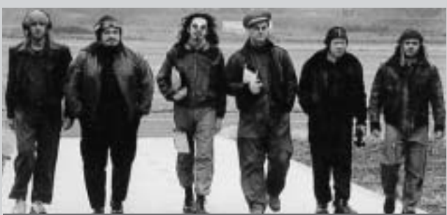
Modena City Ramblers in concerto a Milano il 10 settembre.