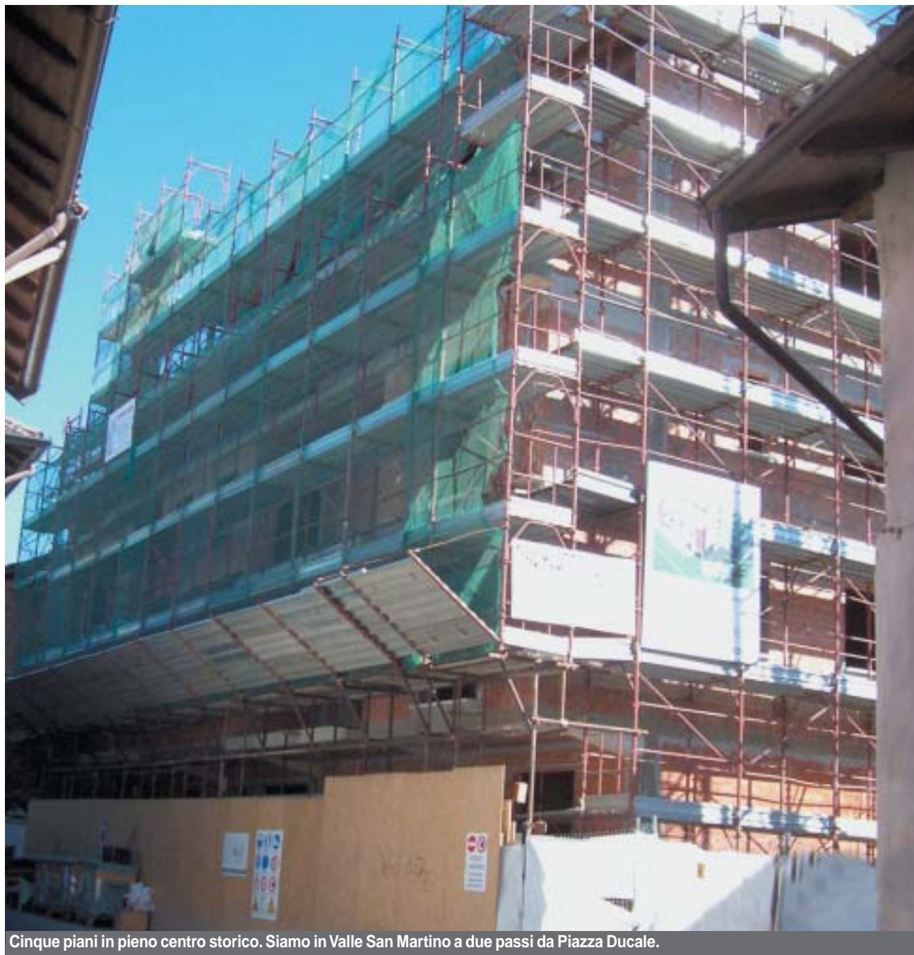
Cinque piani in pieno centro storico. Siamo in Valle San Martino a due passi da Piazza Ducale.

Tutto ciò è stato in parte soppiantato dalle nuove tendenze, l'urbanistica cosiddetta contrattata. Quest'ultima se da un lato ha il vantaggio, ammesso che lo sia veramente, di essere snello, poco vincolante, dall'altro lascia presupporre che l'interesse pubblico risieda in tutti noi. Ma così non è. Ed ecco che ci ritroviamo scuole dove non servono, spazi verdi che non verranno frequentati, concentrazione di agglomerati abitativi