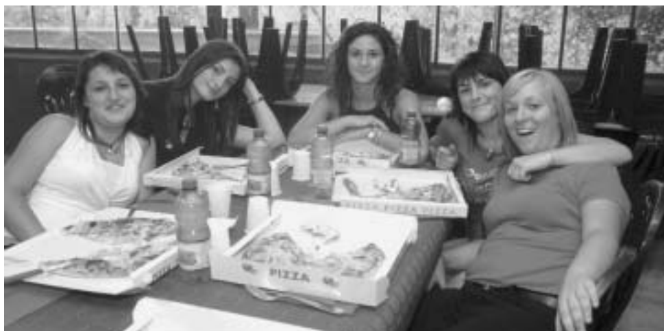
Il meritato riposo dei volontari dopo la "bufera". La Festa è finita, la cucina chiusa, la dispensa svuotata completamente. Non resta che una pizza...