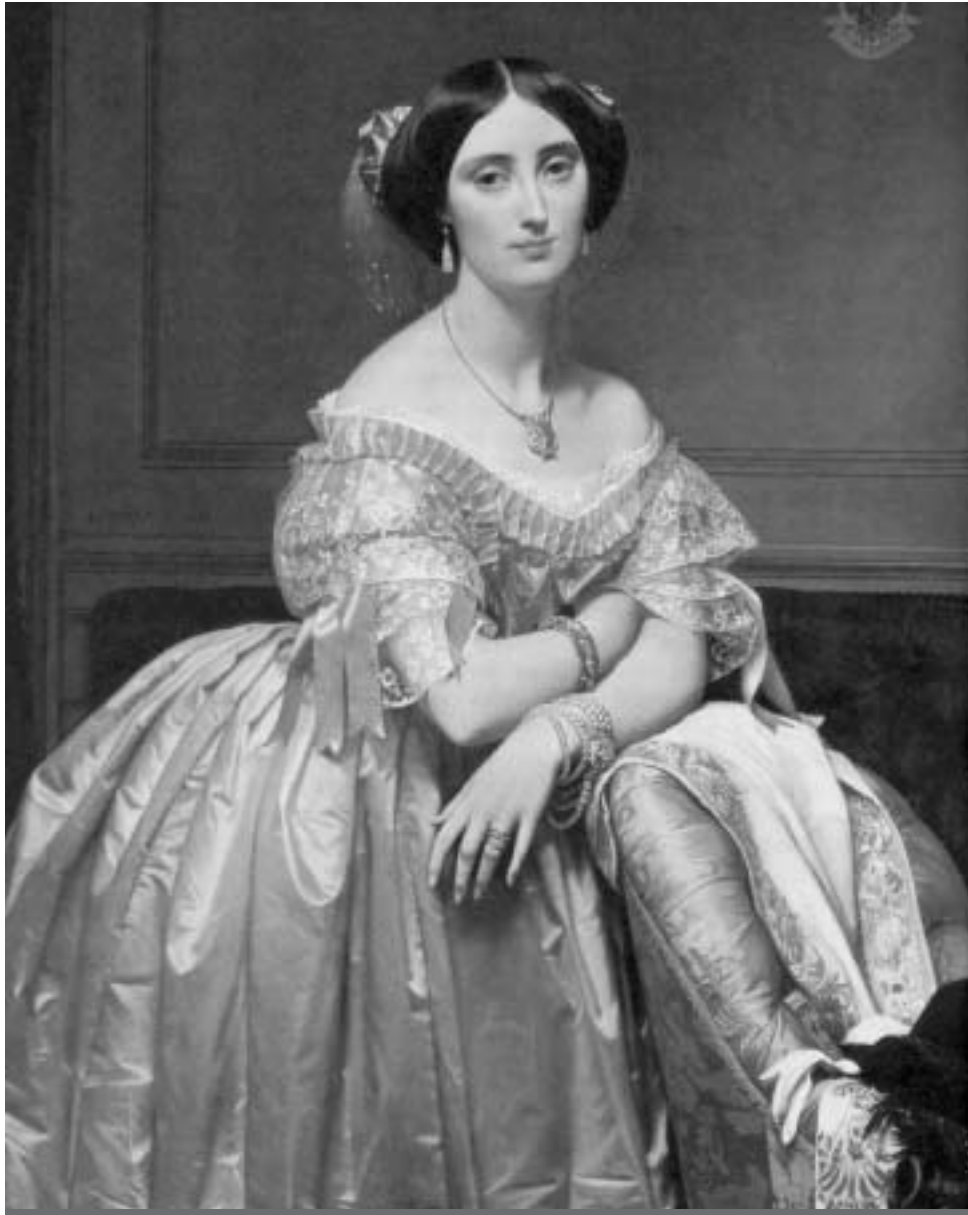
J.A.D. Ingres, "Ritratto della principessa de Broglie", 1853, Metropolitan Museum, New York.

Sorprende che un regista come Rivette, appartenuto alla Nouvelle Vague con Trouffaut, Godard, Chabrol, in questo film usi un linguaggio cinematografico che ricorda Visconti e de Oliveira. La supremazia della forma, un gusto dell'esteriorità napoleonica, sono ottimamente rappresentati con chauffeuse , console , arazzi , letti en bateau , bureau-plat , ottoni, alabastri, fregi e ninnoli egizi. I perso-