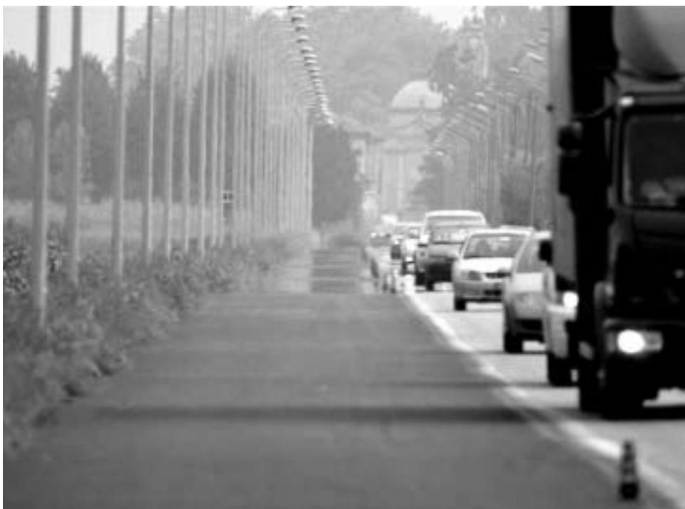
Sopra e sotto: vista della nuova pista ciclabile che corre a fianco di corso Pavia.

Ora, comunque, qualcosa sembra muoversi. A fianco di corso Pavia, nel tratto compreso fra la nuova rotonda e la Sforzesca, si sta realizzando qualcosa che potrebbe anche somigliare a una pista ciclabile. Usiamo il condizionale in quanto quel tratto di strada corre perfettamente parallelo a un'arteria ad alto transito di autoveicoli di ogni genere e non ci sembra perfettamente consono a quanto detta il succitato decreto ministeriale quando precisa che "... favorire e promuovere un elevato grado di mobilità ciclistica e pedonale, alternativa all'uso dei veicoli a motore (...) e nei collegamenti con il territorio contermini (...) puntare all'attrattività, alla continuità ed alla riconoscibilità dell'itinerario ciclabile, privile-