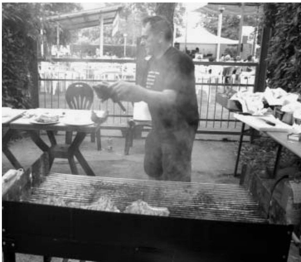
Chili e chili di pregiata carne chianina stanno cuocendo sulla griglia nella serata di chiusura della Festa. Riuscirà il cuoco ad avanzarne almeno una porzione?