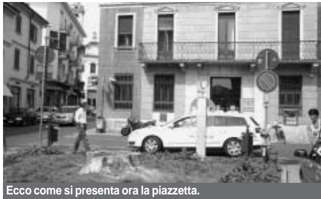
Ecco come si presenta ora la piazzetta.

consueti giri abbiamo notato che si sta costruendo una pista ciclabile accanto alla strada che porta alla Sforzesca. Non le sembrano soldi buttati? Infatti una pista percorribile già esiste da tempo immemorabile: via Rebuffi appunto. Bastavano alcuni accorgimenti e il gioco era fatto. Lontano dal rumore, dal traffico e dal pericolo di essere travolti dalle auto che, su quel lungo rettili-