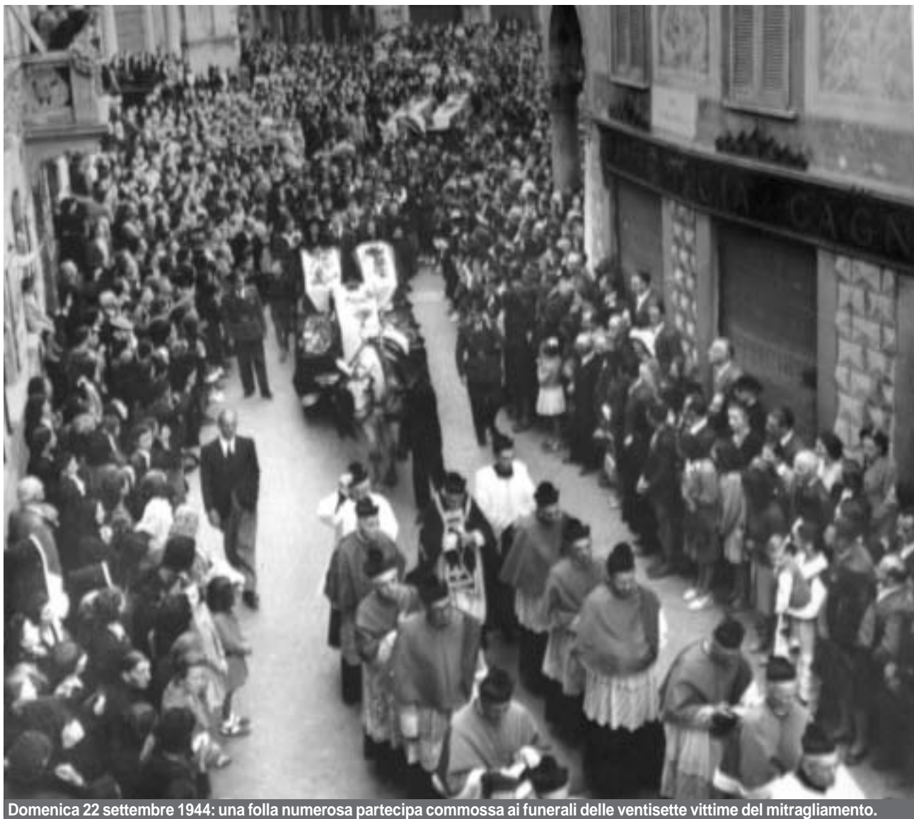
Domenica 22 settembre 1944: una folla numerosa partecipa commossa ai funerali delle ventisette vittime del mitragliamento.

Ultimi mesi di guerra, gli alleati sono già sul suolo italiano. La pace arriverà ma a suon di bombe a massacri. Ecco quanto accadde a Vigevano, sul ponte del Ticino. Un episodio che pochi ricordano.