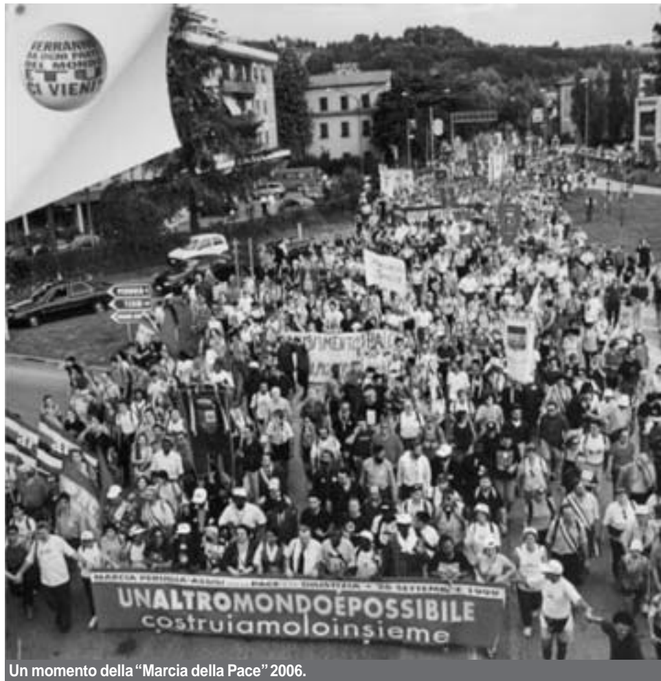
Un momento della "Marcia della Pace" 2006.

Per questo, per promuovere un'educazione alla Pace e ai diritti umani e il suo inserimento nei programmi scolastici e per accrescere l'impegno degli italiani (associazioni, enti locali, organizzazioni laiche e religiose) per la Pace nel mondo, verranno realizzate oltre 500 iniziative in tutta Italia, per chiedere anche alle forze politiche un maggior impegno contro la povertà e a favore di reali e concrete politiche di Pace, come aumentare le