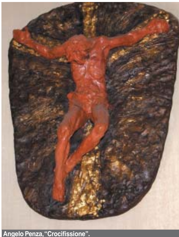
Angelo Penza, "Crocifissione".

I testi scelti e commentati dalla studiosa tracciano un percorso di poesia teologica che procede dal modello per eccellenza, il Paradiso di Dante, passando per autori del '400 e del '500, e giunge al '900 con una serie di variazioni sul tema del sacrificio di Cristo, riflessioni personali e preghiere che non mancano di sorprendere per la somiglianza e la vicinanza fra il passato e il presente. Una somiglianza che la Garavelli osserva in particolare in Gaspara Stampa, vissuta nel '500, e Antonia Pozzi, voce novecentesca, due poetesse accomunate fra l'altro da una vita breve, che cercano a distanza di secoli la stessa identificazione con il do-