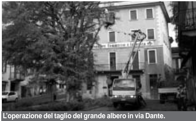
L'operazione del taglio del grande albero in via Dante.

L'abbattimento del fagus sylvatica 'asplenifolia' di via Dante si è reso assolutamente necessario, in quanto l'esemplare era ormai completamente disseccato nella parte basale del tronco fino all'impalcatura principale. Inoltre, sotto le placche di corteccia che si staccavano dal tronco, erano evidenti i fori e le gallerie dei coleot-