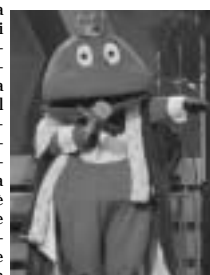
Il Gabibbo condurrà il nuovo TG4 2006?

Buone vacanze e arriverederci a settembre.