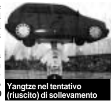
Yangtze nel tentativo (riuscito) di sollevamento

Shanghai è riuscito ad entrare nel Guinness dei primati, riuscendo a tenere sulla testa un'auto del peso di più di 300 chili.