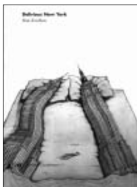
Rem Koolhaas, Delirious New York. Un manifesto retroattivo per Manhattan , a cura di Marco Biraghi, Electa, Milano 2001 (pp. 305, euro 38,73)

È una Manhattan fatta di sogni quella di Koolhaas, senza slum , alloggi convenzionali, centrali elettriche, segni di vita nelle strade. Una visione quasi da turista come lo sono la maggior parte delle visioni europee di New York. Ma anche un'acuta psicoanalisi storica di un progetto collettivo, non formulato a livello cosciente, della costruzione di una città simbolo dell'America e, allo stesso tempo, assolutamente estranea ad essa.