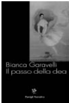
Il passo della dea , Passigli, pp. 256, euro 15,50

Non a caso Alessandro Zaccuri lo ha definito «un thriller esoterico che ritorna con abilità sulle inquietudini, tutt'altro che esaurite, del passaggio da un millennio all'altro, incrociandole con la cronaca minuta di una città tanto sfuggente da suggerire, al proprio interno, l'esistenza di un confine segreto e insondabile, che i protagonisti del romanzo si trovano a varcare in modo dapprima inconsa-