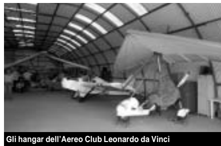
Gli hangar dell'Aereo Club Leonardo da Vinci