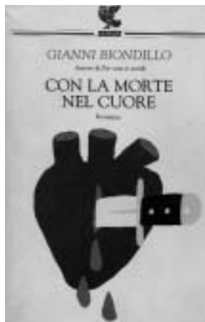
Gianni Biondillo, Con la morte nel cuore , Guanda, 444 pagine, euro 16,00

Nel suo percorso, diventato quasi un viaggio all'inferno, dentro il quartiere