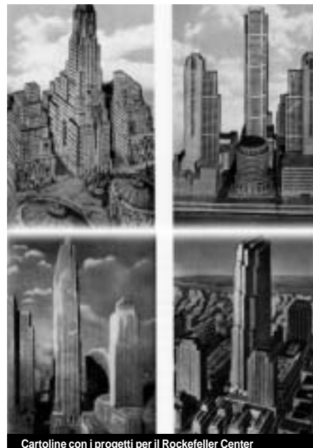
Cartoline con i progetti per il Rockefeller Center

All'interno del Rockefeller Center, Samuel Lionel Rothafel (Roxi), l'esperto di maggior talento dello show-business degli anni Venti,