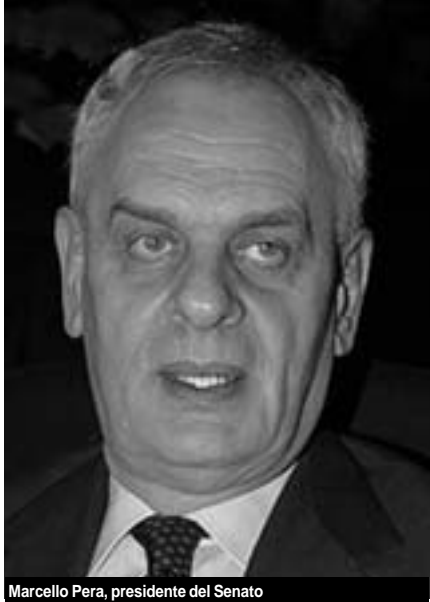
Marcello Pera, presidente del Senato

Il filosofo è Pera, seguito non da "colui" di pariniana memoria, ma preceduto da