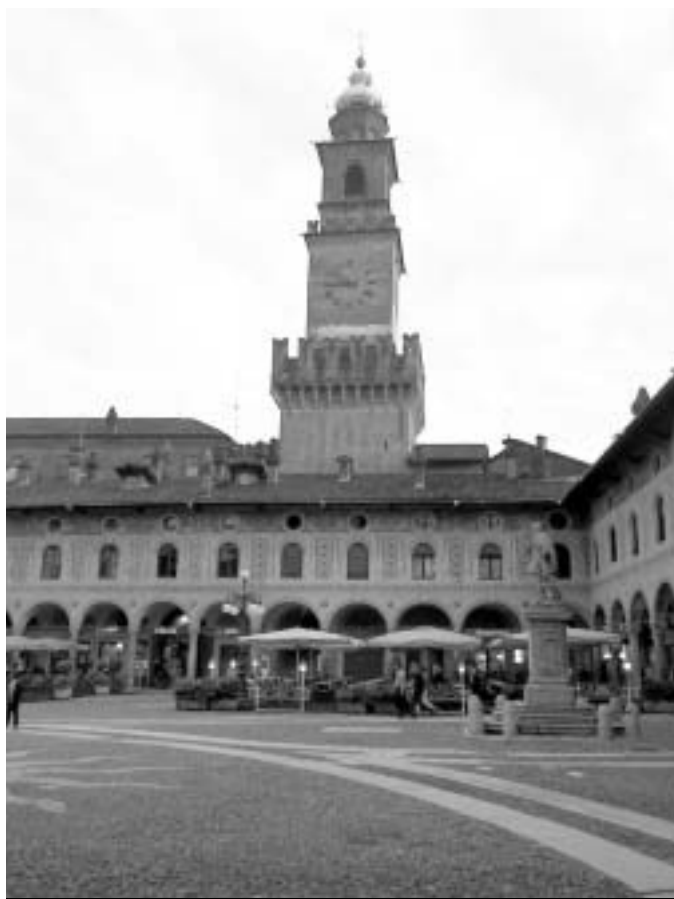
Piazza Ducale e Castello: un patrimonio storico da tutelare e salvare per il rilancio urbanistico

Se e in che cosa è cambiato il ruolo degli Enti