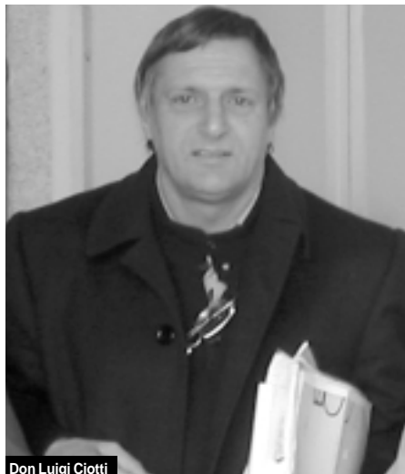
Don Luigi Ciotti