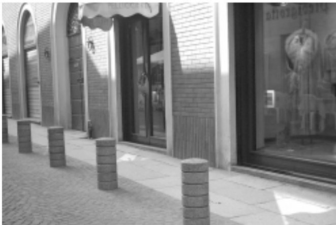
Moderno bigolo Bonecchi, in corso della Repubblica