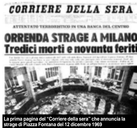
La prima pagina del "Corriere della sera" che annuncia la strage di Piazza Fontana del 12 dicembre 1969

Purtroppo ciò succede molto di rado, un po', perché gli uomini che governano saltuariamente posseggono intelligenza e quando anche così sia, spesso e volentieri la adoperano per dubbi fini, un po', perché gli uomini che eleggono i governanti, quando questi sono eletti, non sempre scelgono il male minore, quello che sembra meno stupido, o meno delinquente, o meno guerrafondaio ed infine perché siamo uomini ed errare è umano. Ma, per la barba di Noè, perseverare è diabolico!