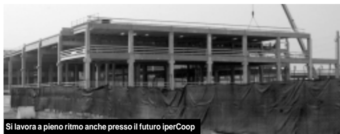
Si lavora a pieno ritmo anche presso il futuro iperCoop