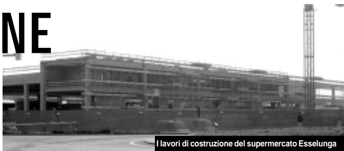
I lavori di costruzione del supermercato Esselunga

Conclusione. Primo: abbiamo perso due anni, si sono spese tante parole e i buoni forzaitaloti, leghisti compresi che si sono sempre scagliati contro questa iattura, alla fine hanno dovuto rimangiarsi tutto. Secondo: in quattro anni di governo non sono riusciti a programmare e mettere in cantiere nessuna grande opera. Semplicemente si sono limitati a portare a termine quanto già programmato dalla precedente giunta. Volevano cambiare il volto alla città. Hanno dovuto cambiare le loro opinioni. E, tanto per cambiare, si sono autopromossi salvatori della patria.