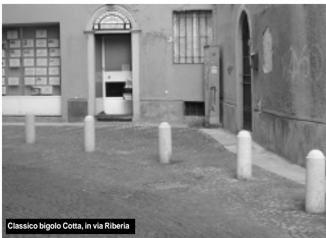
Classico bigolo Cotta, in via Riberia