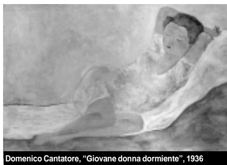
Domenico Cantatore, "Giovane donna dormiente", 1936