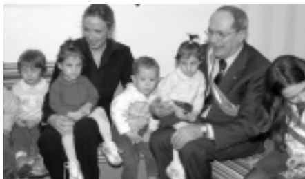
Due momenti dell'inaugurazione del nuovo nido "Pollicino" in comune. Sopra: il ministro Prestigiacomo e il sindaco Cotta. Sotto: l'assessore Mairate (a sinistra) con il ministro