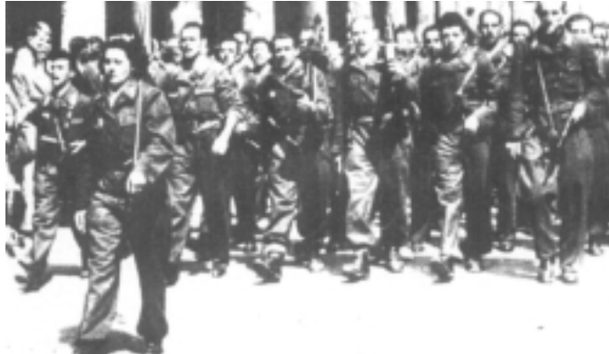
I partigiani entrano nella Milano liberata il 25 aprile 1945