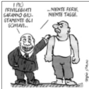
Si ringrazia S. Staino per la gentile concessione

2 GIUGNO Motivazione: a cosa serve festeggiare la Repubblica... è un giornale Comunista!