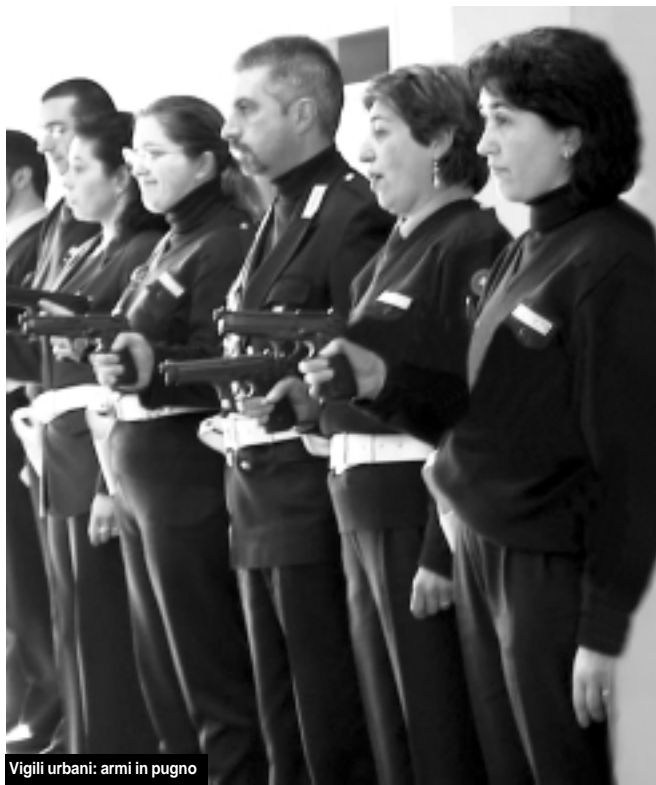
Vigili urbani: armi in pugno

I primi tre mesi del 2004 hanno avuto un andamento inquietante con la non lusinghiera media di una rapina alla settimana. Beffarda, recentemente, la seconda incursione dei ladri a casa dell'assessore Giargiana. Ed anche la rapina all'Acì avvenuta a marzo assume un carattere surreale se si pensa che gli autori sono stati identificati come sessantenni. In una città che cerca pace in ogni modo, persino recintando con minacciose punte metalliche il suo Parco, anche i pensionati si danno al crimine. Del resto anche i dati nazionali sui reati dimostrano che la campagna sulla sicurezza lanciata dal centro-destra è una autentica truffa ai cittadini. Città più sicure era uno dei famosi manifesti di Berlusconi e a tre anni di distanza i dati sono impietosi. Tra il 2002 e il 2003 le rapine sono aumentate del 9,5 per cento, le estorsioni dell'8, i sequestri di persona del 6 per cento. Sono soprattutto le truffe però a crescere (+ 21 per cento) e chissà se la Cassazione facendo i calcoli ha messo nel conto anche quelle rifilate agli italiani dal premier. In diminuzione sono soltanto le violenze sessuali (meno 21 per cento, un dato confortante) e gli omicidi, sia quelli tentati sia quelli consumati (ma di appena l'1,7 per cento). Il governo ha fatto molta propaganda al "poliziotto di quartiere" ma sono ben poche le realtà nelle quali questa figura è stata istituita e, secondo i dati