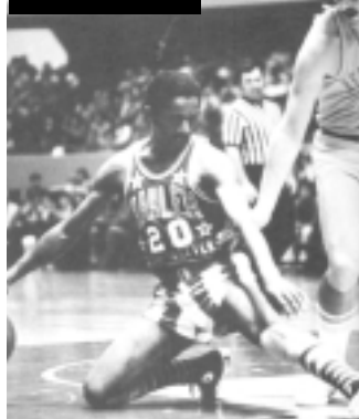
Marques Haynes, degli Harlem Globetrotter

the game (cioè, "innalzando il gioco"), storia ed estetica degli afroamericani nella pallacanestro (edito da Simon & Schuster nel 1992).