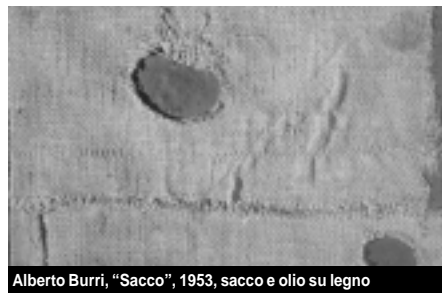
Alberto Burri, "Sacco", 1953, sacco e olio su legno

Alla fine del denso percorso, al vertice dell'essenza poetica del dipingere, ecco la sezione intitolata all'incanto della luce. Il discorso, iniziato nel nome del realismo di Renzo Vespiagnani, si conclude con la "poesia" cromatica di Vincenzo Parea, vigevanese ormai affermato nella sua qualità d'artista. «Con la pittura di Vincenzo Parea - scrive Claudio Cerritelli nel ricco catalogo - entriamo in un'elaborazione della luce che trasforma l'analisi scientifica delle componen-