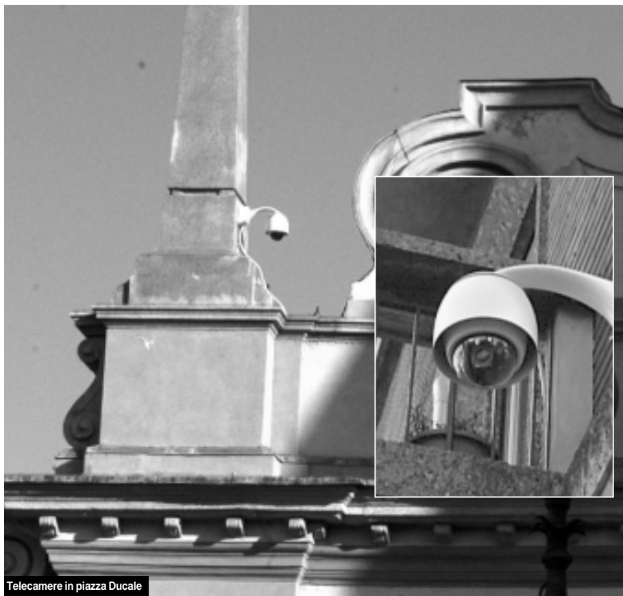
Telecamere in piazza Ducale

passi. Ma il comando chiude a mezzanotte e riapre alle 7 del mattino. Quindi via libera ai teppisti e amen per i 90.000 euro buttati alle ortiche. Ma andiamo avanti. Difficile capire il senso della telecamera piazzata all'angolo tra via del Carrobbio e via della Costa. Lì davanti ci sono i gradini e il sagrato di san Pietro Martire, noto ritrovo delle brutte facce sgradite a Prati (extracomunitari). Non c'è problema: se cercate le brutte facce spostatevi cento metri più in là e le troverete. Cosa è cambiato? Nulla.