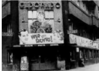
Sopra: esterno dell'Eldorado, locale frequentato dagli omosessuali nella Berlino degli anni '30