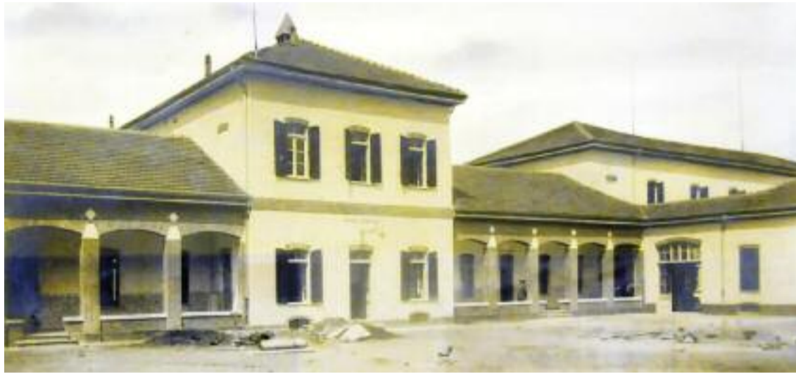
Alcune immagini di come si presentava la casa di riposo De Rodolfi fino al 1982. Cioè quando ancora era un Ipab, prima che il Comune di Vigevano ne assumesse il patrimonio e la gestione diretta.

Fu per porre rimedio a questa intollerabile situazione che il Comune di Vigevano, in accordo con la Regione Lombardia, decise nel maggio del 1982 di assumere, previo scioglimento dell'Ipab, la proprietà dell'intero patrimonio dell'Istituto (comprensivo dell'immobile costituente la casa di riposo, di due importanti e storici edifici in via Riberia, del palazzo Merula, del palazzo di via Persani, di via Cesarea e di alcune cascine ecc...) e la gestione della casa di riposo. Questa fu la premessa necessaria senza la quale nulla di ciò che poi è avvenuto sarebbe potuto accadere. Fu in sostanza la condizione essenziale perché si avviasse poco dopo una operazione di massicci investimenti per una trasformazione radicale e profondissima della struttura che è diventata, nel corso degli anni,