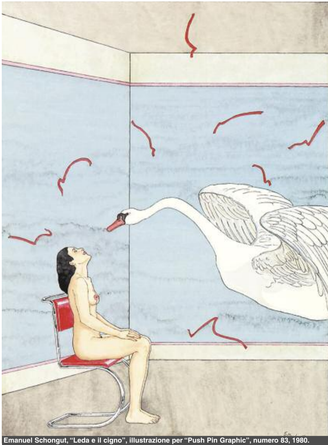
Emanuel Schongut, "Leda e il cigno", illustrazione per "Push Pin Graphic", numero 83, 1980.

È tra gli ideatori e organizzatori del festival di poesia itinerante "Luoghi diVersi".