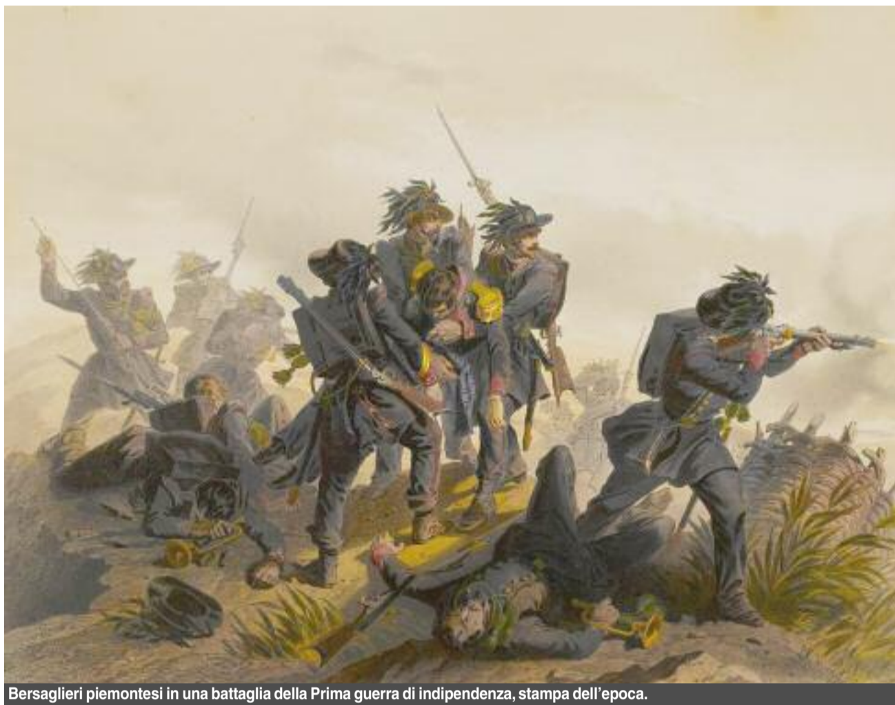
Bersaglieri piemontesi in una battaglia della Prima guerra di indipendenza, stampa dell'epoca.

Alcuni documenti d'Archivio riportano i lunghi elenchi degli oggetti rubati, le denunce dei danneggiati, oltre che le richieste di rimborso per le perdite su-