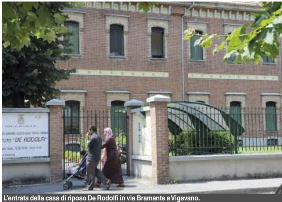
L'entrata della casa di riposo De Rodolfi in via Bramante a Vigevano.

Ma è proprio vero che un privato riuscirà a far fruttare meglio e di più la casa di riposo? Stando a quanto affermato dal primo cittadino sì. Troveranno nuovi campi di intervento e, dunque, nuovi clienti. «Preferisco spendere i soldi di tutti per molte più persone. 107 ospiti sono troppo pochi per quanto spende il Comune». Parola di Sindaco.