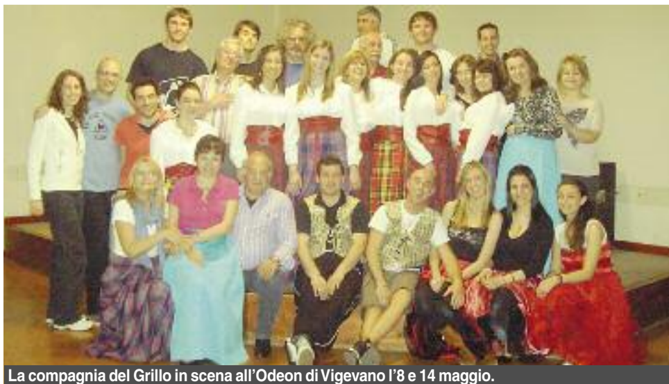
La compagnia del Grillo in scena all'Odeon di Vigevano l'8 e 14 maggio.

La vicenda ha inizio a Vigevano dove Michela è stata incaricata di accompagnare la cuginetta dal dentista. La piccola protesta, non vuole passare anni ad interpretare il ruolo di mostro con fili metallici tra i denti. Non vuole mettere l'apparecchio. La maggiore cerca di rassicurarla e rabbonirla, dicendole che ha lo stesso aspetto e lo stesso carattere delle trisnonna. Quale trisnonna? Com'era la nonna? Ha una foto? Perché nessuno ha mai raccontato questa storia? Impossibi-