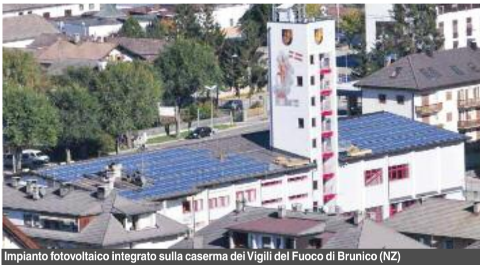
Impianto fotovoltaico integrato sulla caserma dei Vigili del Fuoco di Brunico (NZ)

Nel 94% dei Comuni italiani sono installati impianti da fonti rinnovabili. Sono, infatti, 7.661 i municipi che ospitano almeno un impianto da rinnovabile, rilevati nel Rapporto Comuni Rinnovabili 2011 di Legambiente.