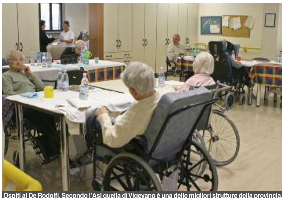
Ospiti al De Rodolfi. Secondo l'Asl quella di Vigevano è una delle migliori strutture della provincia.

Eppure... Eppure una struttura come il De Rodolfi può funzionare al meglio anche se gestita pubblicamente. E se alla collettività costa qualcosa non vediamo proprio dove sta lo scandalo. Servizi sociali e assistenziali sono una delle prerogative spettanti alle Amministrazioni locali, in primis i Comuni. Se così